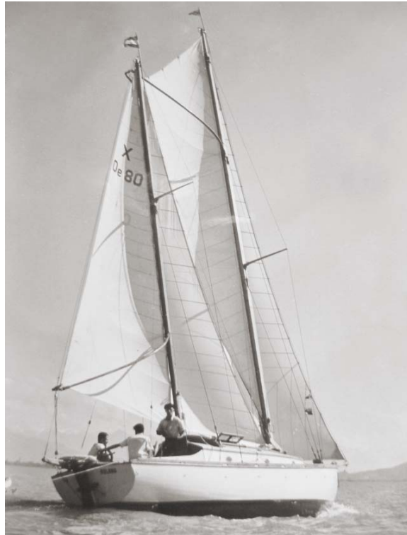
Ruhige Zeiten – ein stolzes Schiff in den 50er Jahren: „Roland“ eine der ersten großen Yachten in unserem Verein.