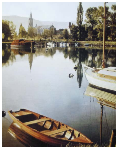
Viel frei – noch kein Liegeplatzmangel zu Beginn der 60er Jahre.