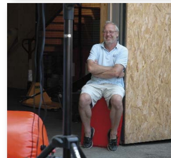
Brave Helfer haben eine Pause verdient!