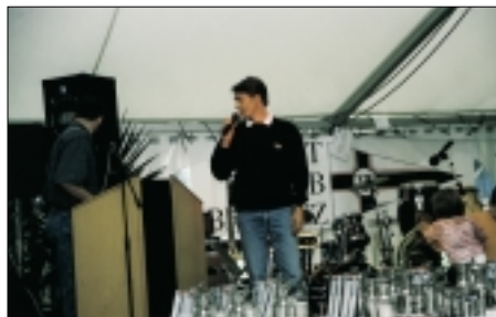
Die high-speed Ausfahrt mit der „Gummi-Rennsau“ war sehr gefragt.