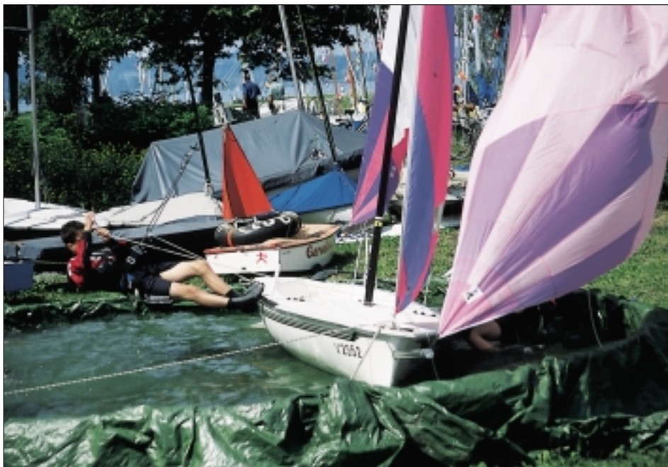
Die Attraktion für Mutige, Trapezsegeln am Land bei Windstärke 5, geblasen von einer Schneekanone.