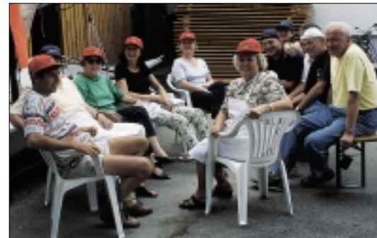
Verdiente Pause unserer guten Geister.