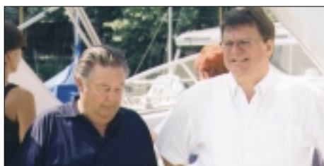
Kritische Beobachter: Ehrenpräsident Stiastrny und Präsident Weh, beide aber sichtlich zufrieden