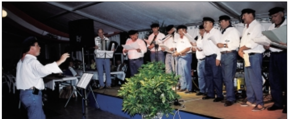
Der YCB Seemannschor begeisterte alle Anwesenden.