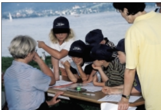
Die Segelsport Schnupper Rallye für Kinder, wie man sieht, auch knifflige Aufgaben wurden mit Spass gelöst.